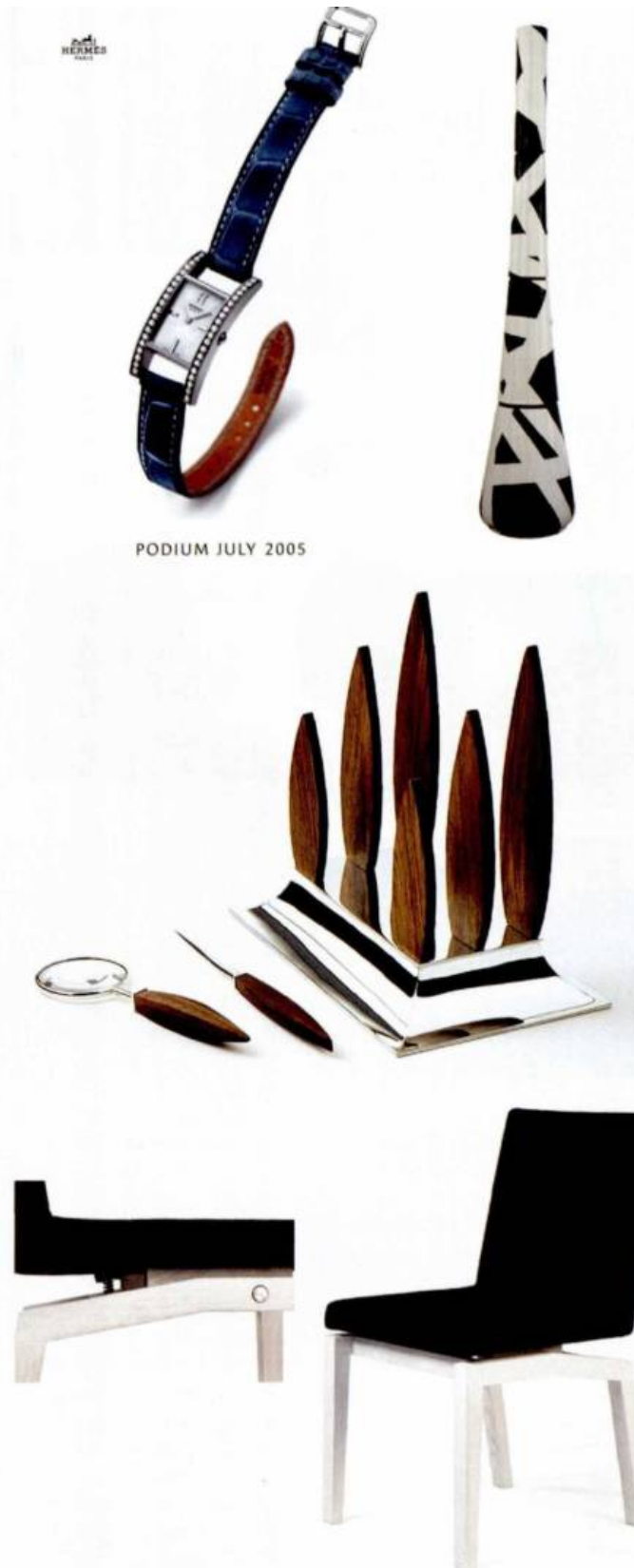
PODIUM JULY 2005

KORTRIJK XPO. COURTRAI – WWW.INTERIEUR.BE